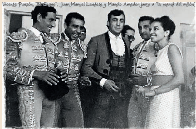
Cartel de la primera corrida de Asprona

con la mala suerte de que me rompe el brazo izquierdo, en concreto el húmero. Eso fue bastante peor que una cornada puesto que estuve año y medio parado, seis tornillos y una placa que todavía llevo en el brazo. Además tuve el infortunio que a los seis meses más o menos de la rotura cuando estaba haciendo rehabilitación del brazo, al salir de la piscina me escurrí caí al suelo y me volví al romper el brazo por el mismo sitio, una fatalidad. Hay se quedaron las 50 corridas que tenía firmadas y prácticamente todos los esfuerzos realizados en temporadas anteriores además de el estar en candelerero dentro de la fiesta.