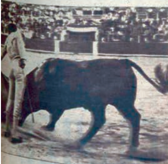
Un toro en un natural