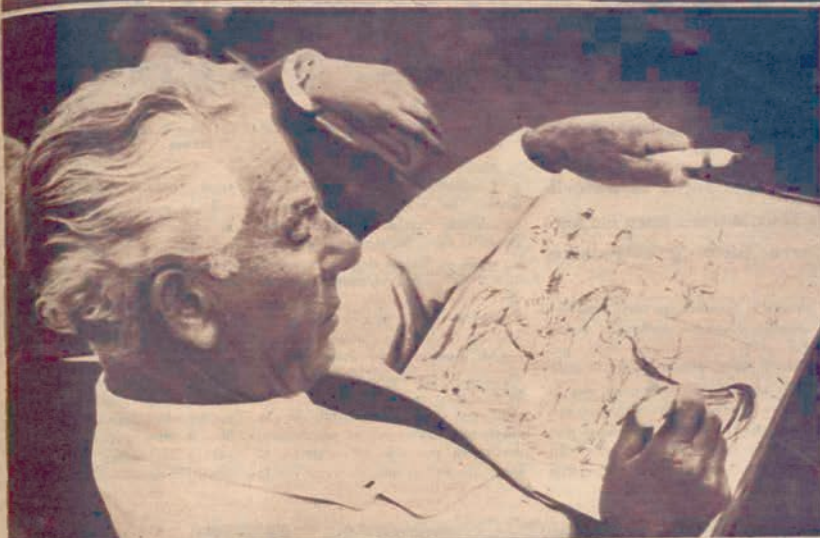
Benjamin Palencia, nuestro genial pintor, tomando apuntes, desde un burilero, en Albacete

final, y hubo grande ovación, vuelta al ruedo con petición de oreja y despedida triunfal.