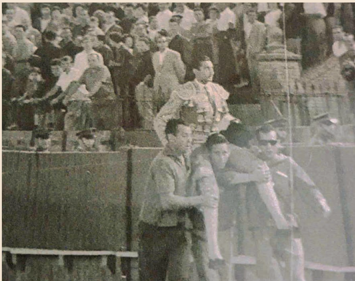
Salida a hombros en su presentación como novillero en Sevilla