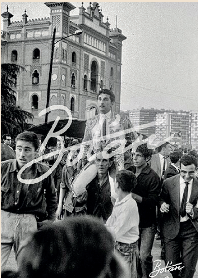
Tarde de confirmación en Madrid, dos orejas