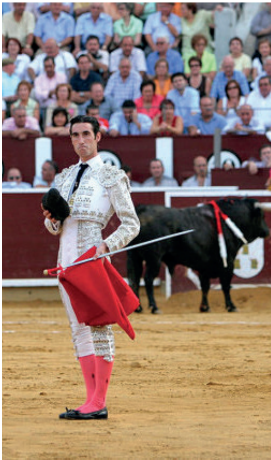
La tarde de la alternativa en Albacete