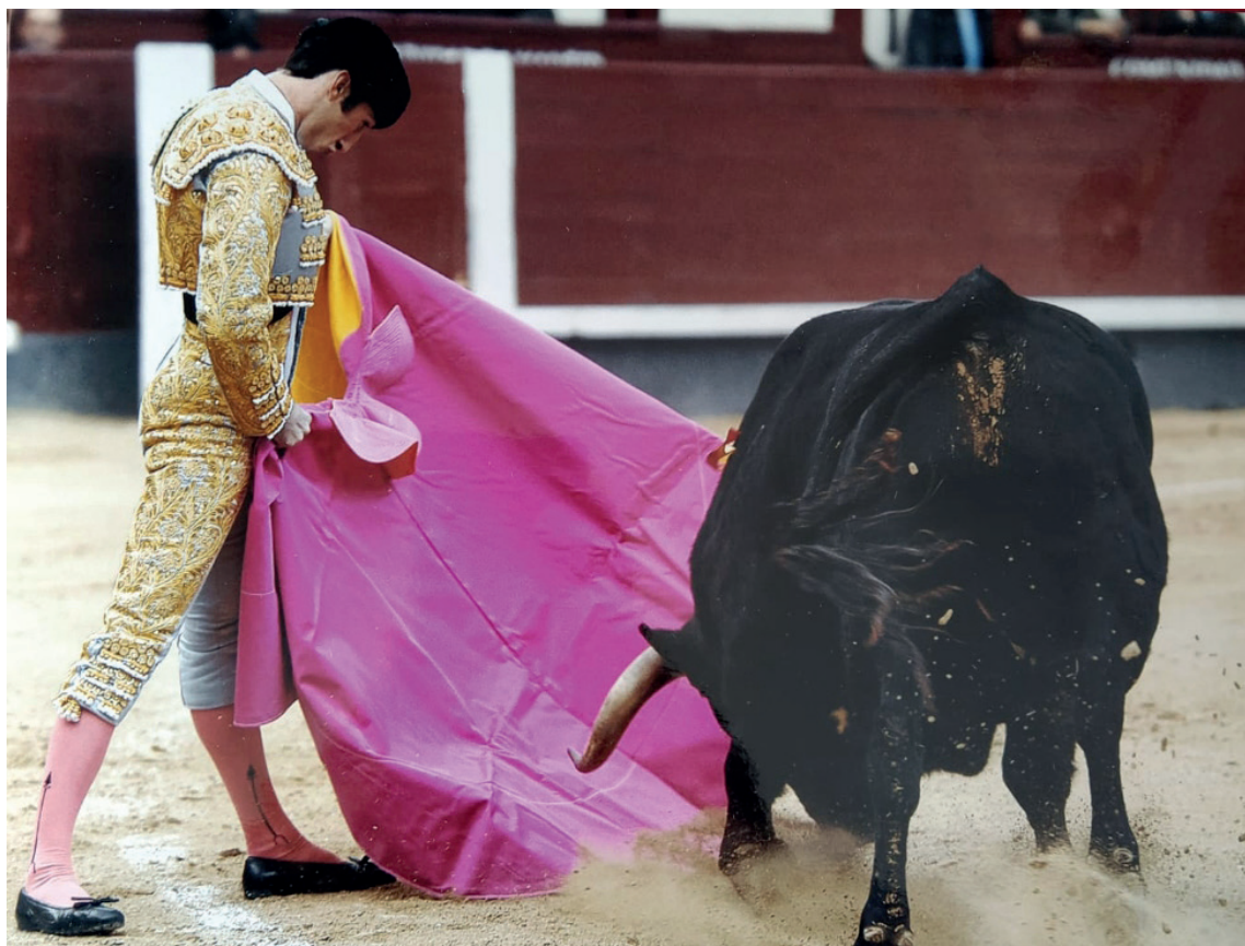
Una de las tardes de Madrid

por la ventanilla del coche fue mi padre.