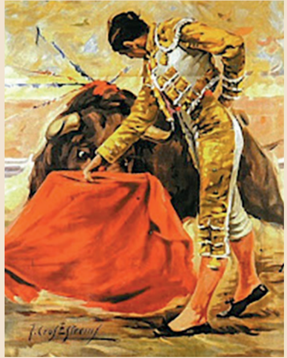
Litografía de dos carteles de la época donde sirvió de inspiración la tauromaquia de Manuel Amador