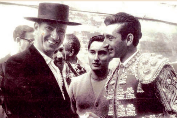
Con Carlos Arruza en un tarde juntos