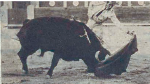
Luis Miguel Dominguín en un buen natural